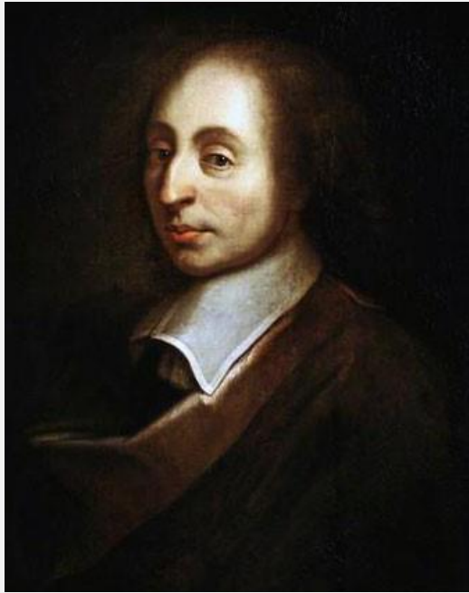
Portrait de Pascal par François II Quesnel, Château de Versailles, Archives Dagli Orti.